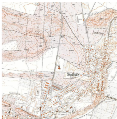
Szkic orientacyjny skala 1:10000

GEODETA UPRAWNIONY mgr inż. Jarosław Trojanowski świad. nr 23043 Imię i nazwisko geodety uprawnionego, nr uprawnień i podpis geodety